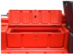
WYJMOWANA BAKISTA BOCZNA 440 zł