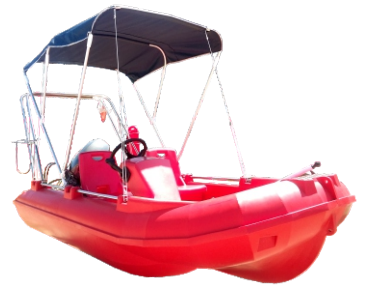
DASZEK BIMINI 880 zł