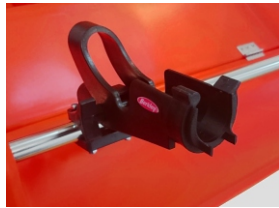
UCHWYT NA WĘDKI 140 zł