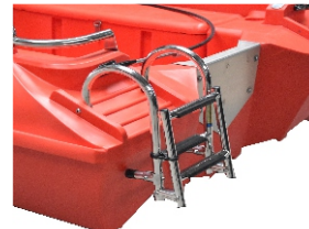
DRABINKA RUFOWA 640 zł