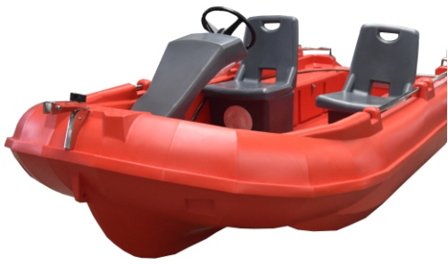
FOTEL STERNIKA / PASAŻERA 540 zł/szt.