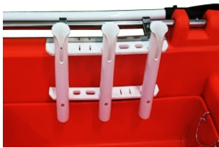
STOJAK NA WĘDKI 240 zł