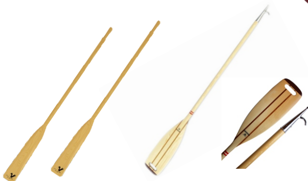
WIOSŁA 340 zł/KPL