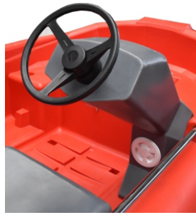
KONSOLA STEROWNICZA Z KIEROWNICĄ, PRZEKŁADNIĄ, STEROCIAGIEM 4 390 zł