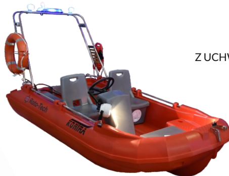
RAMA NAWIGACYJNA Z UCHWYTEM NA KOŁO RATUNKOWE I BOJKĘ 1 600 zł