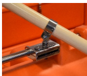
DULKI 300 zł/KPL.