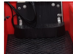
POMPA ŻĘZOWA Z OBUDOWĄ 600 zł