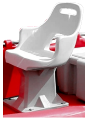
FOTEL KAPITAN Z PODSTAWKĄ 990 zł