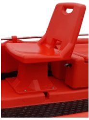
FOTEL Z PODSTAWKĄ 880 zł