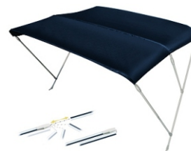
DASZEK BIMINI 1 050 zł