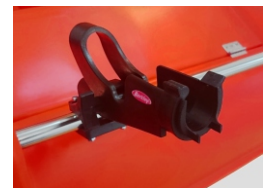
UCHWYT NA WĘDKĘ 140 zł./SZT.