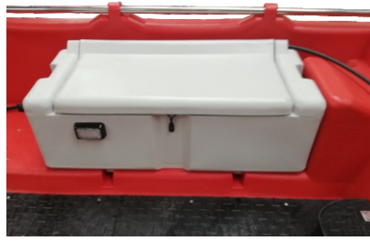
BAKISTA BOCZNA 770 zł