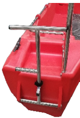
WINDA DZIOBOWA/ RUFOWA 390 zł./SZT.