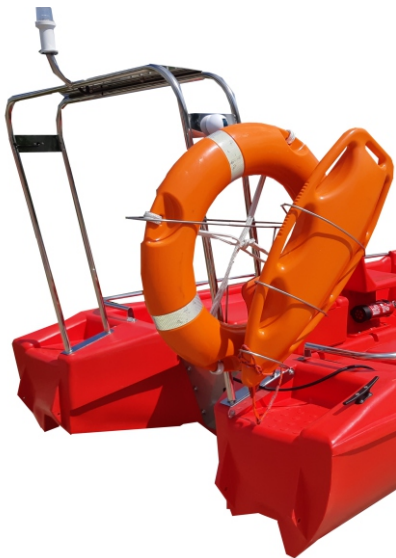
RAMA NAWIGACYJNA Z UCHWYTEM NA KOŁO RATUNKOWE, BOJKĘ 1 600 zł