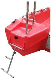
DRABINKA 640 zł